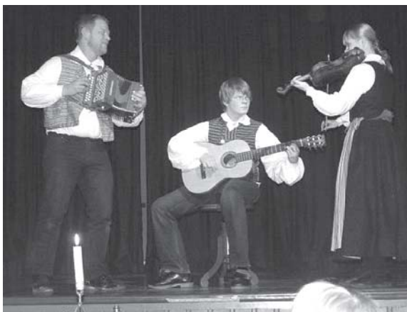
Familjen Carr i aktion