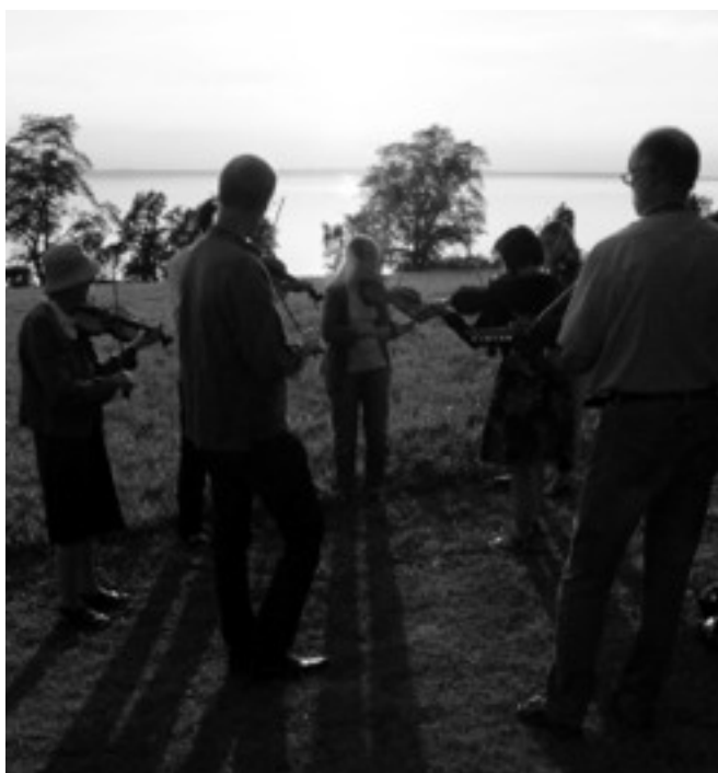
Kan Ni tänka Er vackrare plats att spela buskspel?